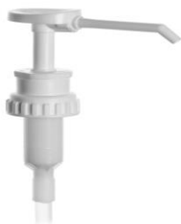
POMPA 4 ML per flacone 1 lt. codice EPO070101