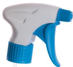
SPRUZATORE REGOLABILE VELA. codice EPO070117