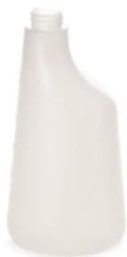
BOTTIGLIA NEUTRA 600 ML. codice EPO070114