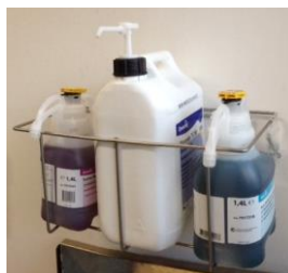
CESTELLO PORTA TANICHE Codice INJ11148 (1 TANICA) Codice INJ11149 (2 TANICHE)