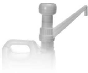
POMPA 30 ML per tanica 5 lt. codice EPO070118