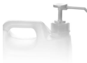
POMPA 4 ML per tanica 5 lt. codice EPO070109