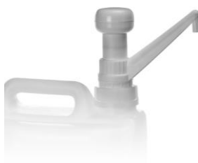
POMPA 30 ML per tanica 10 lt. codice EPO070119