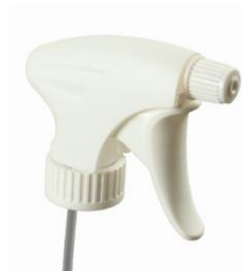
SPRUZZATORE REGOLABILE VELA. Codice EPO070117