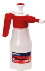
Flacone TEC 1000 NBR. Serbatoio da Lt. 1,31 con ugello regolabile. Codice EPO070123