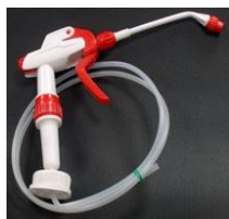
SPRUZZATORE PER MASTER TECNO GEL Codice JON7510496