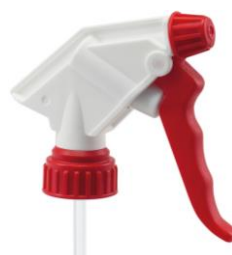
SPRUZZATORE MAX 360. Spruzzatore in grado di erogare liquidi anche con flacone capovolto, ugello regolabile Codice EPO070122