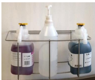
CESTELLO PER DUE TANICHE codice INJ11149 CESTELLO PER UNA TANICA INJ11148