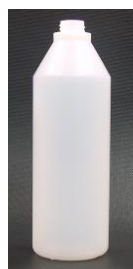
BOTTIGLIA GRADUATA DA 1035cc cc100 Codice EPO070105