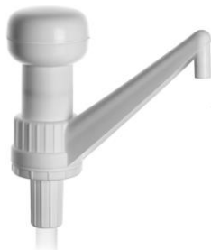
POMPA PER LT 5 – 30 ml. Codice EPO070118 POMPA PER LT. 10 - 30ml. Codice EPO070119