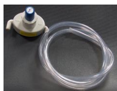
DOSATORE MANUALE DISP PLUS Codice INJDPL02