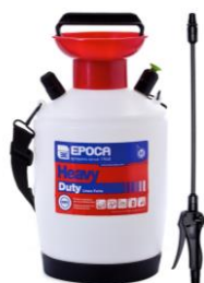
Flacone con lancia TEC 5 NBR Serbatoio da Lt. 5, lancia da 40 cm, tubo da 1,5 mt.