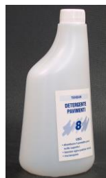
BOTTIGLIA NEUTRA 600 ML. Codice EPO070114