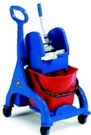
CARRELLO ORION lt. 15 conf. Singolo unità di vendita minima 1 pezzo codice FIL7961A/P