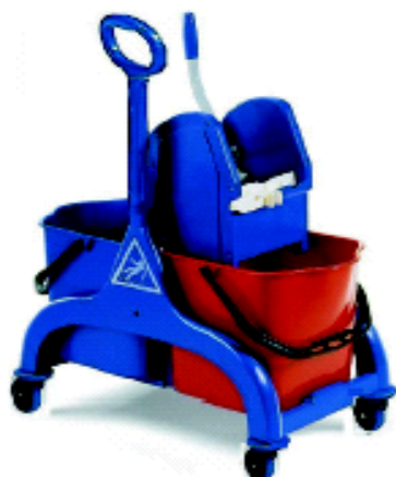
CARRELLO FRED lt. 30 conf. Singolo unità di vendita minima 1 pezzo codice FIL7960A/P