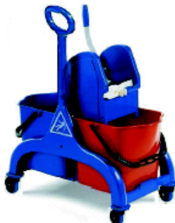
CARRELLO FRED lt. 50 conf. Singolo unità di vendita minima 1 pezzo codice FIL7965A/P