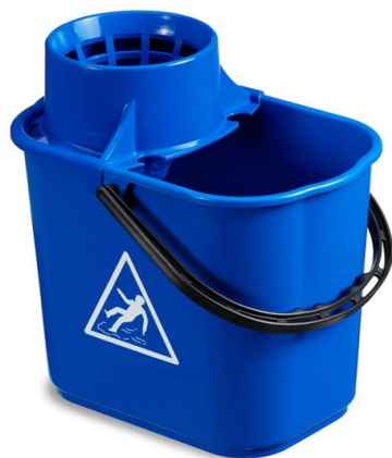
SECCHIO MASTER LUX lt. 16 conf. ct 10 pz. U.V.M. 1 pezzo codice FIL2051A