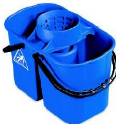
SECCHIO GEMINI lt. 15 due vasche conf. ct da 6 pz. U.V.M. 1 pezzo codice FIL2061A