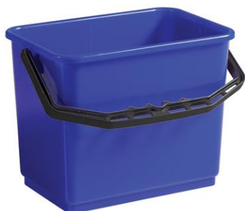
SECCHIO lt. 6 BLU Conf. Singola codice FIL8218A SECCHIO lt. 6 ROSSO conf. singola codice FIL8218B SECCHIO lt. 6 GIALLO conf. sing. codice FIL8218C SECCHIO lt. 6 VERDE conf. singola codice FIL8218F