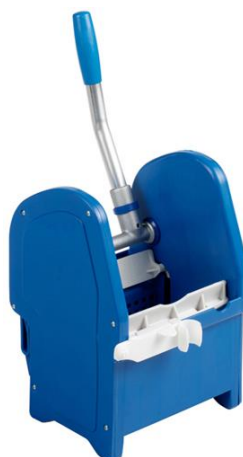
STRIZZATORE REGULAR Confezione cartone da 1 pezzo unità di vendita minima 1 pezzo codice FIL7004A