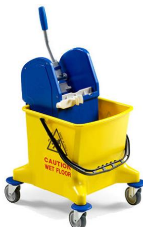
CARRELLO BABY mono vasca lt. 25 conf. Singolo unità di vendita minima 1 pezzo codice FIL7970CGB